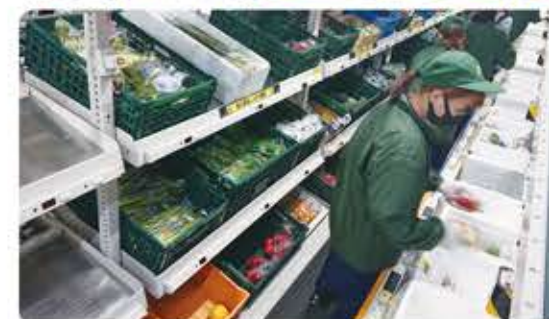
一定速度でライン上を流れる箱に、注文された商品を入れていきます。人員も増やして作業していますが、セットできる商品には限界があります。